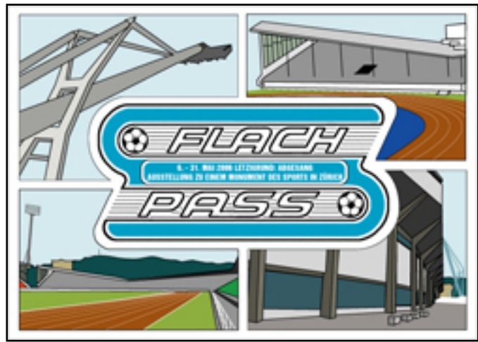
Der Flyer zur Ausstellung

Im Rahmen der Ausstellung Letzigrund: Abgesang wird ein Erlebte Schweiz Abend stattfinden, der die Besucher und Besucherinnen der Flachpassbar nicht nur von Fussballhelden, sondern auch von Stadien, Kurven und Rängen schwärmen lassen wird. Gäste: Hans-Dieter Gerber, Historiker | Fabian Brändle, Historiker